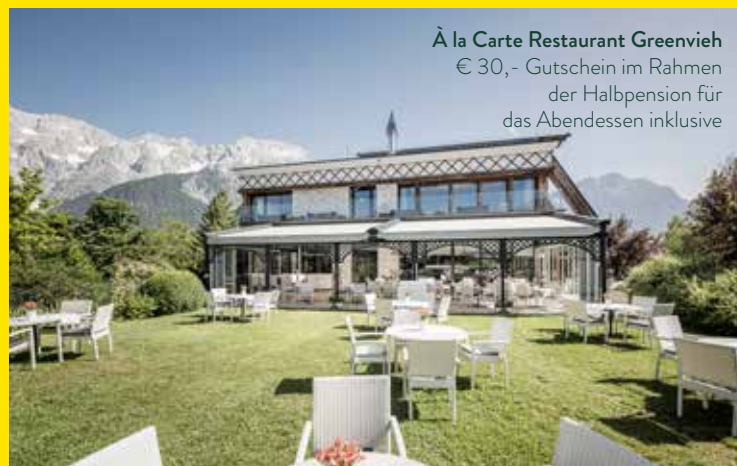
À la Carte Restaurant Greenvieh € 30,- Gutschein im Rahmen der Halbpension für das Abendessen inklusive