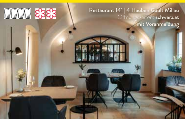
Restaurant 141 | 4 Hauben Gault Millau Öffnungszeiten: schwarz.at mit Voranmeldung