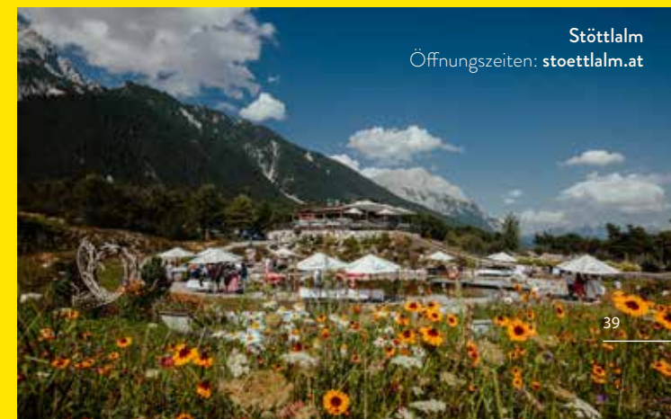
Stöttlalm Öffnungszeiten: stoettlalm.at